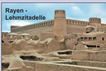
Rayen - Lehmzitate

Ausflug nach Rayen für die Besichtigung der Lehmzitate, auf der Route Fahrt zurück nach Mahan für den Besuch des Prinzen-Gartens und des Shah Nematollah Vali Mausoleums. Abendessen und Übernachtung in Kerman.