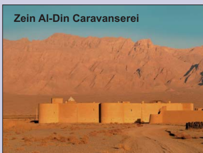
Zein Al-Din Caravanserei

Nach dem Frühstück Fahrt zur Caravanserei Zein Al-Din, entlang der Berge und dem Wüstenrand, vorbei an vielen Pistazien-Gärten und Feldern.