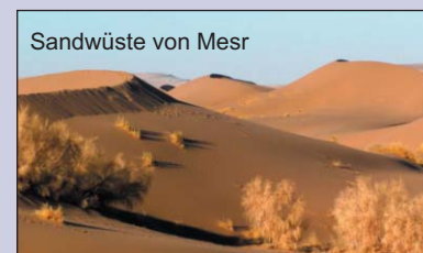
Sandwüste von Mesr

Nach dem Frühstück Ausflug in die bekannte Sandwüste von Mesr mit Kamelreitmöglichkeit und anderen Aktivitätsmöglichkeiten auf den Sanddünen. Abendessen und Übernachtung in Khur.