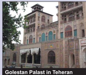
Golestan Palast in Teheran

Nach dem Frühstück Streifzug durch den Basar von Teheran, Besichtigung im Golestan Palast, Mittagspause im Café Naderi, Restaurant auch abgeschlossen. Transfer zum nationalen Flughafen und Flug nach Kerman am frühen Abend, Transfer zum Hotel. Abendessen und Übernachtung in Kerman.