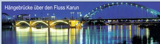
Hängebrücke über den Fluss Karun

Besichtigung der Hängebrücke mit 1500 m über den Karun Fluss in Ahwaz, eine deutsche Konstruktion von 1936. Fahrt nach Bushehr über den Hafen Deilam entlang des Persischen Golfs. Übernachtung im Delvar Hotel 4*