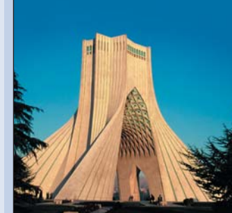
Teheran – Azadi-Denkmal