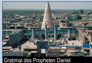
Grabmal des Propheten Daniel